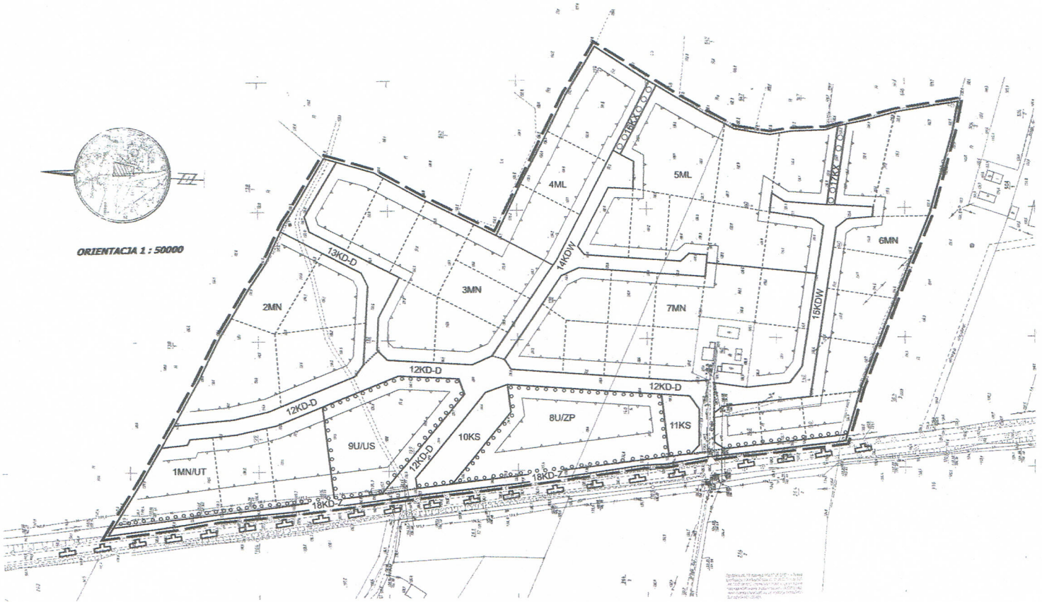
Wyciąg z rysunku "Stadium uszeregowania i kierunków zagospodarowania przestrzennego gminy Górzno"